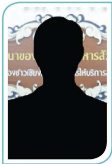
(-ว่าง-) หัวหน้าฝ่ายการเงิน