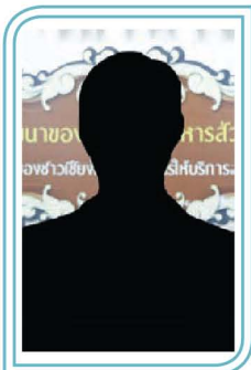
(-ว่าง-) หัวหน้าฝ่ายเครื่องจักรกล