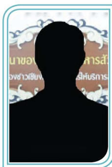
(-ว่าง-) หัวหน้าฝ่ายบริหารงานทั่วไป