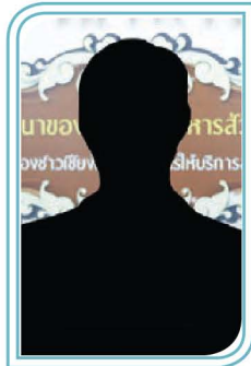
(-ว่าง-) หัวหน้าฝ่ายสำรวจและออกแบบ