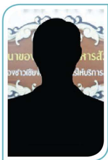
(-ว่าง-) หัวหน้าฝ่ายนโยบายและแผน