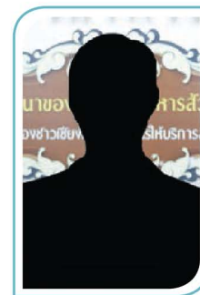
(-ว่าง-) หัวหน้าฝ่ายตรวจสอบ ติดตาม และประเมินผลแผนงานและโครงการ